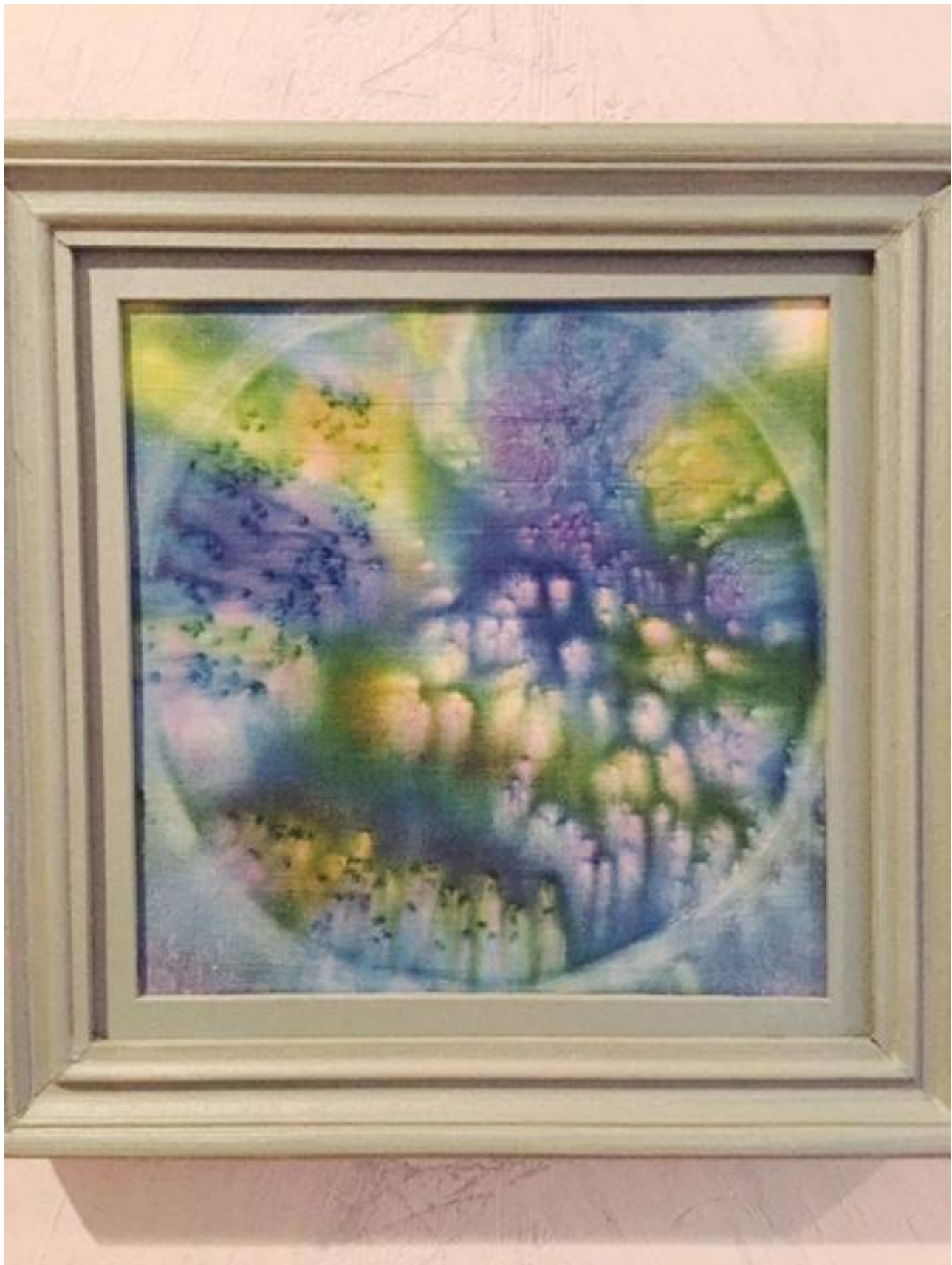
Рождение вселенной (батик).