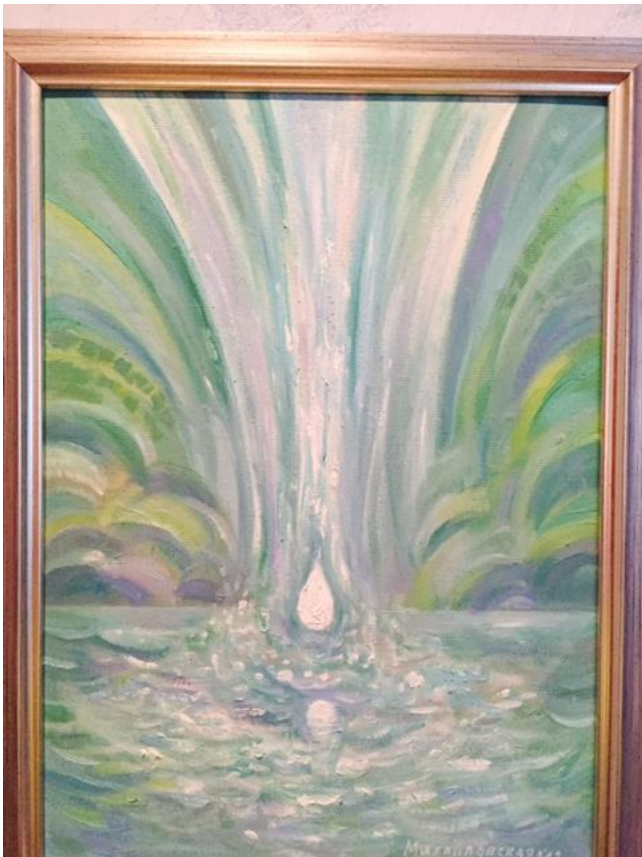
Деяние (холст, масло).