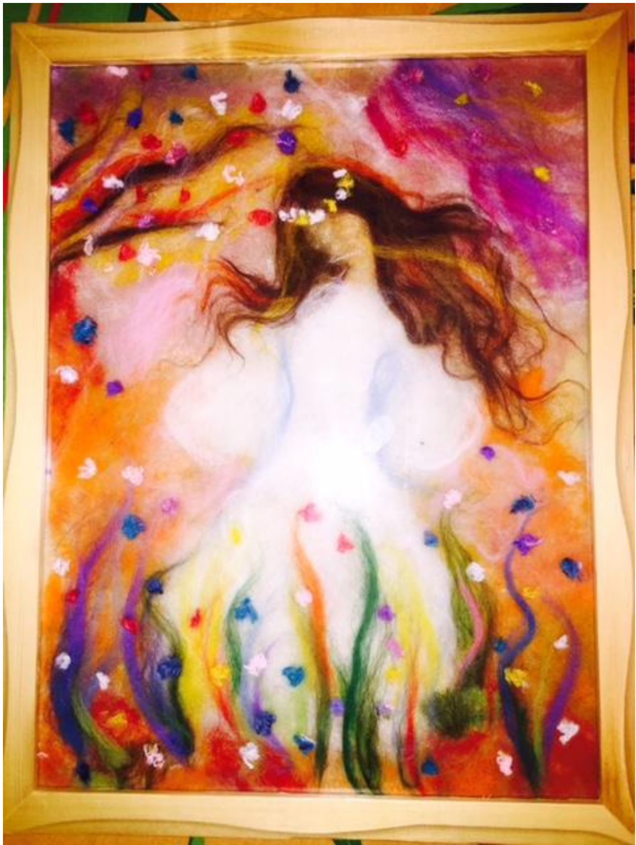
Она (шерстяная акварель).