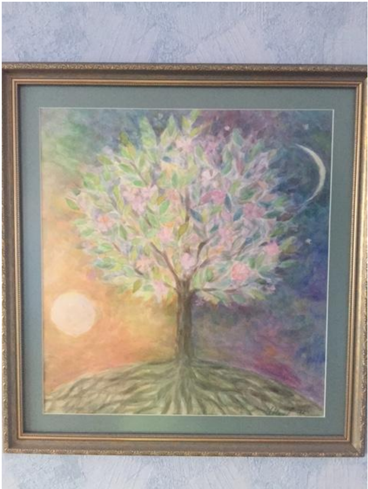
Светлое и темное (смешанная техника).